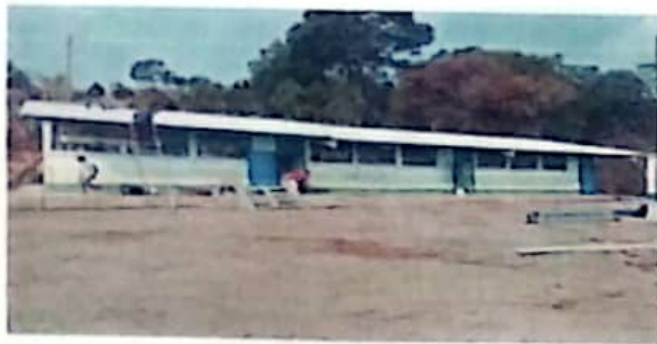
Foto1: Deinstalación de lámina