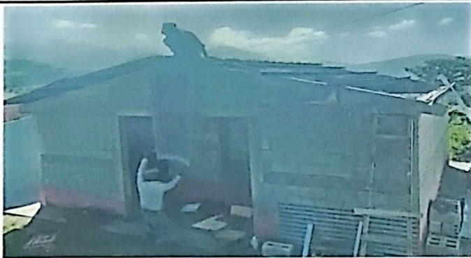
Módulo 2: Foto 1: Desinstalación de láminas del Servicio Sanitario.