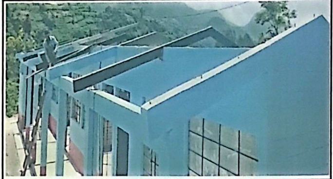
Módulo 1: Foto 2: Desinstalación de costaneras del techo de la Escuela.