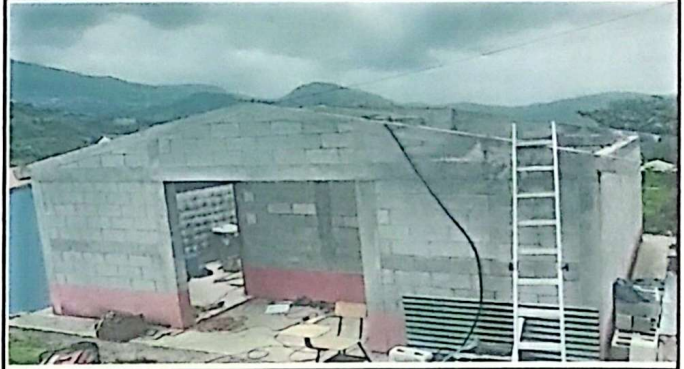
Módulo 2: Foto 2: Desinstalación de costaneras del techo del Servicio Sanitario.