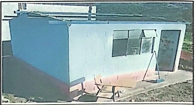
Módulo 3: Foto 2: Desinstalación de costaneras del techo de la Cocina.

Observación: Si es necesario se pueden agregar hojas adicionales y actualizar el número de hojas.