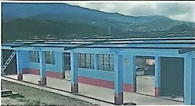
Módulo 1: Foto 1: Desinstalación de láminas de la Escuela.