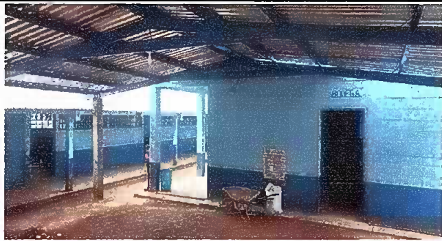
Foto1: Modulo 1 y 2: Pintura en paredes interiores y exteriores