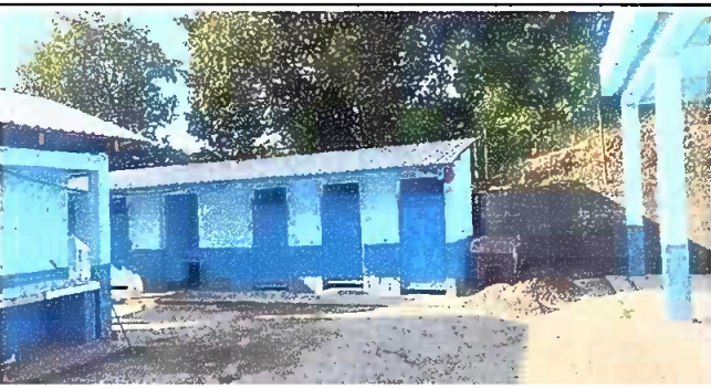
Foto 3: Modulo 3: puertas de los sanitarios instaladas y reparadas.