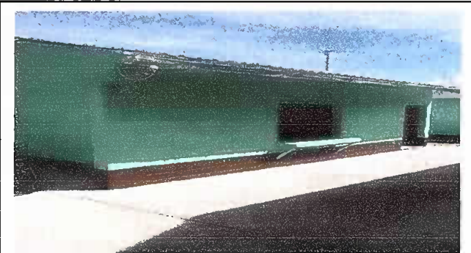
Foto 4: Fotografía tomada al concluir con los modulos del remozamiento.