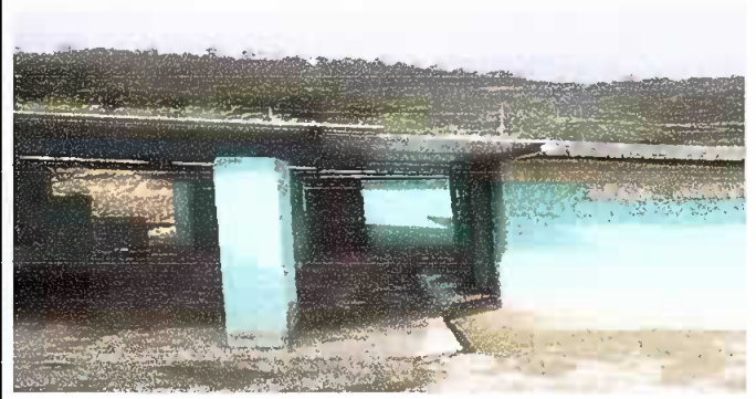
Foto 2: Fotografía tomada al concluir con los modulos del remozamiento.