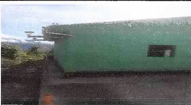
Foto 3: Fotografía tomada al concluir con los modulos del remozamiento.