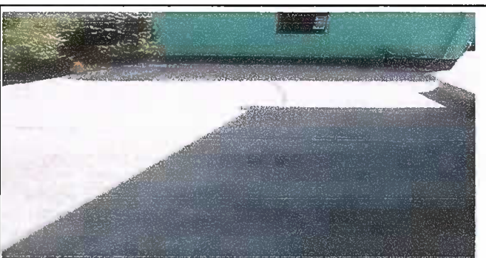
Foto 6: Fotografía tomada al concluir con los modulos del remozamiento.

Observación: Si es necesario se pueden agregar hojas adicionales y actualizar el número de hojas.