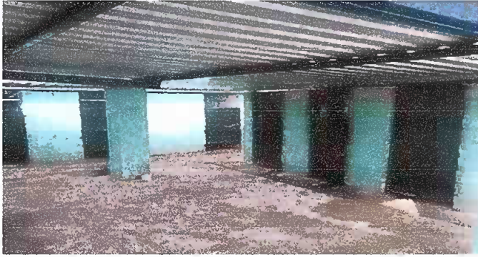
Foto1: Fotografía tomada al concluir con los modulos del remozamiento.