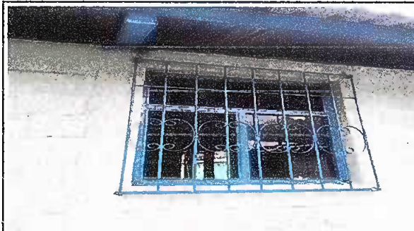
Foto : 2 Aula, Ventanas y balcones nuevos