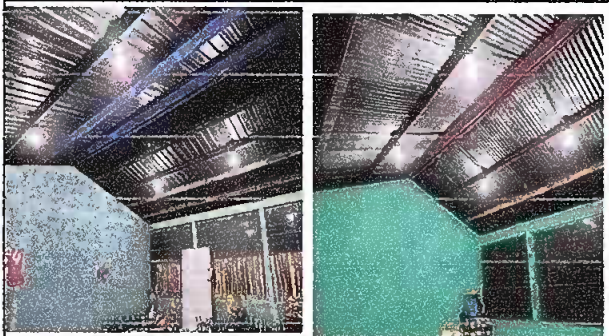
Foto : 3 Cableado y alumbrado nuevo