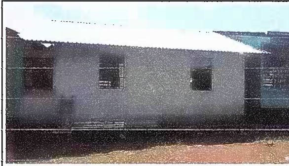
Foto: 4 Sustitucion de laminas, por laminas trokelada