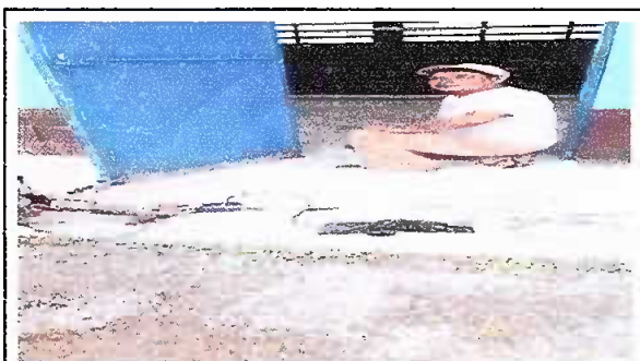
Foto : 6 chapa y pintura nueva

Observación: Si es necesario se pueden agregar hojas adicionales y actualizar el número de hojas.