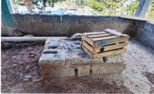
Foto1: Cambio de estufa (pollo) en mal estado.