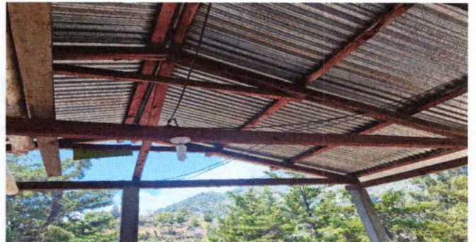
Foto 6: Costaneras de cocina de techo de infraestructura en mal estado.

Observación: Si es necesario se pueden agregar hojas adicionales y actualizar el número de hojas.