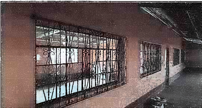
Foto 5: Aula No. 1 y 2 Nueva estructura de ventanas y balcones parte frontal.

Observación: Si es necesario se pueden agregar hojas adicionales y actualizar el número de hojas.