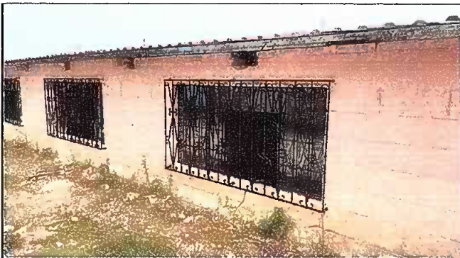
Foto 3: Aula No. 1 y 2 Nueva estructura de ventanas y balcones, parte opuesta.