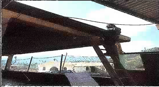
Foto 1. Módulo 1. Corredor, Sustitución de lámina por lamina troquelda calibre 26 Aluzinc y sustitución de estructura de soporte de metal por metal.