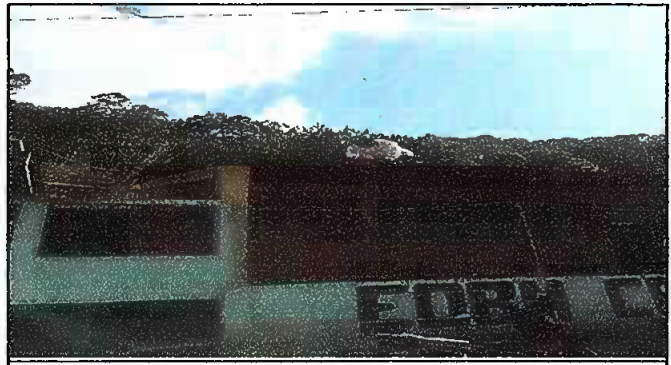
Foto 4. Módulo 1. Aula 1, Sustitución de lámina por lamina troquelda calibre 26 Aluzinc y sustitución de estructura de soporte de metal por metal.