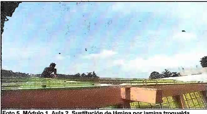
Foto 5. Módulo 1. Aula 2. Sustitución de lámina por lamina troquelda calibre 26 Aluzinc y sustitución de estructura de soporte de metal por metal.