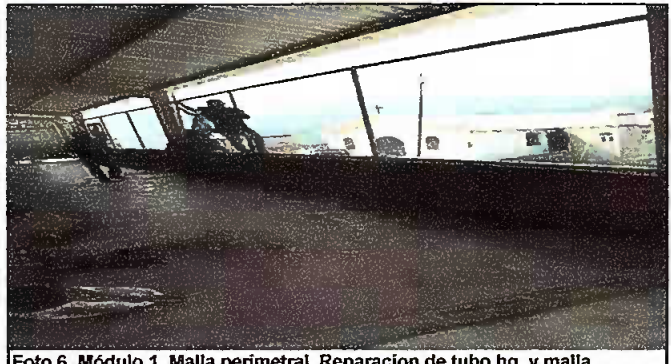
Foto 6. Módulo 1. Malla perimetral, Reparación de tubo hg, y malla galvanizada

Observación: Si es necesario se pueden agregar hojas adicionales y actualizar el número de hojas.