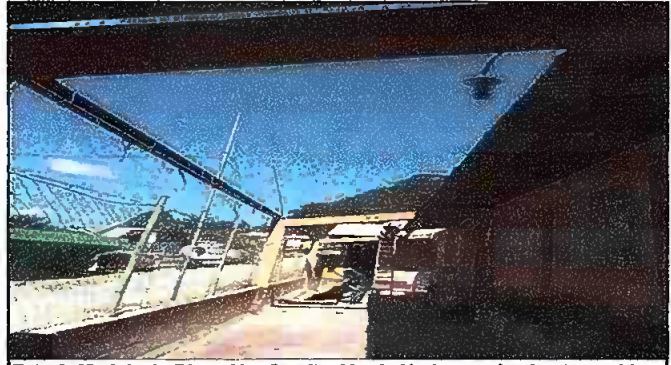
Foto 2. Modulo 1. Dirección, Sustitución de lámina por lamina troquelda calibre 26 Aluzinc y sustitución de estructura de soporte de metal por metal.