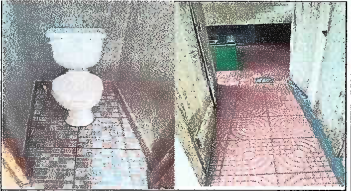
Foto2: Instalación de tazas, colocando ceramico antideslizante y arreglando el drenaje culminado.