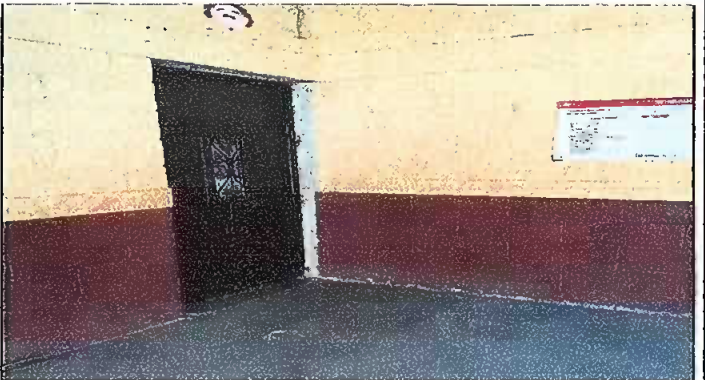
Foto 4. Sustitución de una puerta culminada.