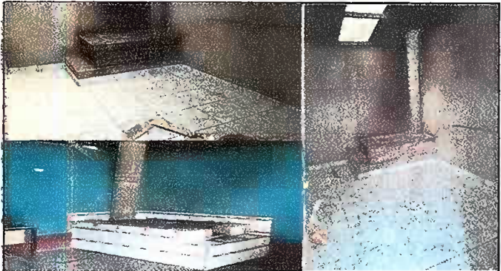
Foto3. Instalación de chimenea y sustitucios de piso de torta por piso ceramico culminado.