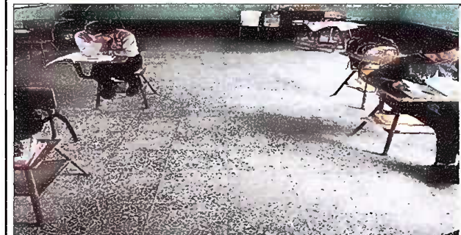
Fotografía No 5: piso cambiado Aula No. 2, módulo 1