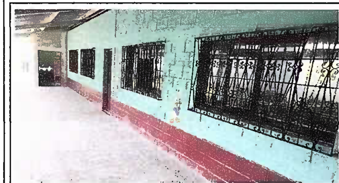
Fotografía No. 4: balcones instalados, Módulo 1,