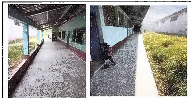
Fotografía No. 6: piso Corredor cambiado, modulo 2

Observación: Si es necesario se pueden agregar hojas adicionales y actualizar el número de hojas.