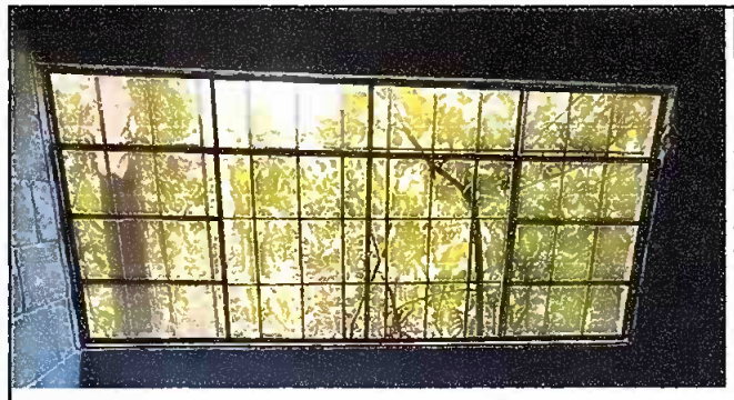
Fotografía No. 5: Balcones y ventanas instaladas bodega, módulo 1