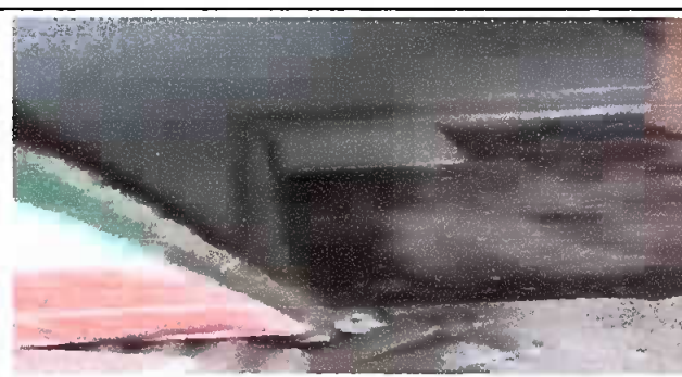
Fotografía No. 6: piso Corredor cambiado, modulo 2

Observación: Si es necesario se pueden agregar hojas adicionales y actualizar el número de hojas.