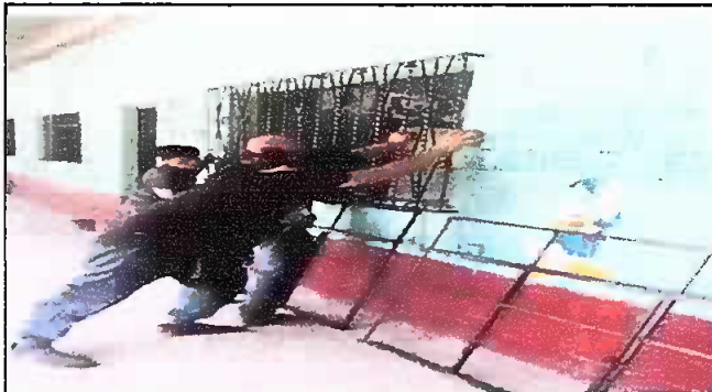
Fotografía No. 5: instalando balcones y ventanas, módulo 1