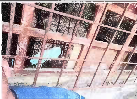
Fotografía No. 4: instalando balcones, Módulo 1,