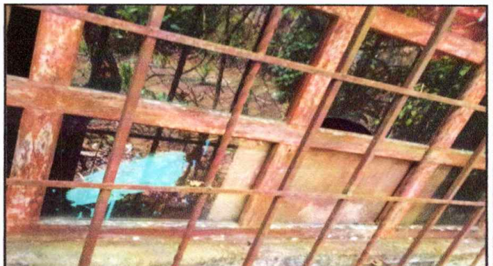
Fotografía No. 5: instalación de Balcones, módulo 1