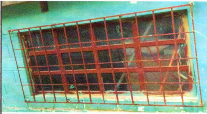
Fotografía No. 4: instalación de balcones, Módulo 1,