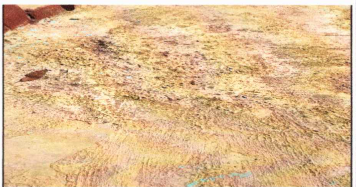
Fotografía No. 6: Cambio de piso Corredor, modulo 2

Observación: Si es necesario se pueden agregar hojas adicionales y actualizar el número de hojas.