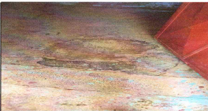
Fotografía No 5: Cambio de piso Aula No. 2, módulo 1