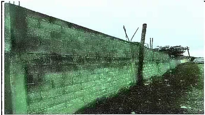
Foto2: Lvantado de muro perimetral de division del centro educatico y la calle publica