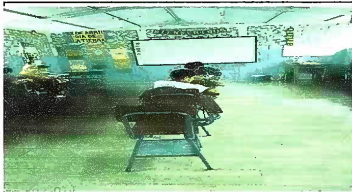
Foto3: Sustitucion de piso torta de concreto, por piso ceramico en las aulas 1, 2, 3, 4, 9, 10 y 10