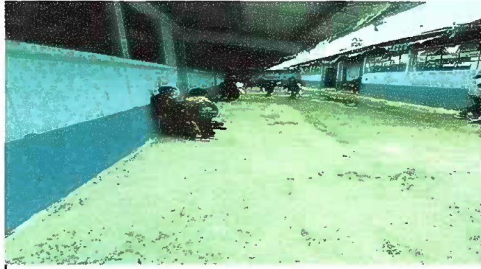
Foto1: Reparación de piso de torta de concreto en el corredor.