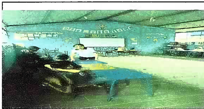
Foto 5: Sustitución de piso torta de concreto por piso ceramico en aulas 1,2,3,4,9, 10 y 11.