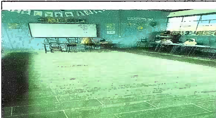
Foto 4: Sustitucion de piso torta de concreto, por piso ceramico en aulas 1, 2, 3, 4, 9, 10 y 11