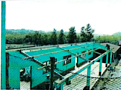
Foto 3: Situación de colocación de costaneras edificio dos parte baja.