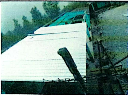
Foto 5: Situación colocación de techo nuevo edificio dos parte baja.