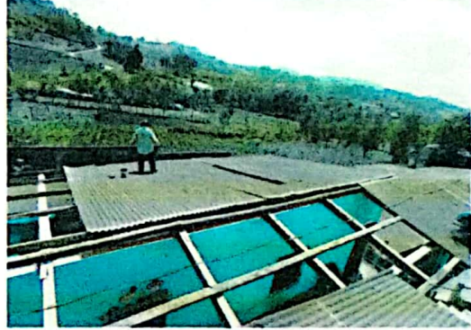
Foto 2: Situación de la estructura desentechando edificio dos parte baja.