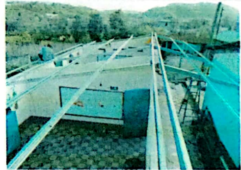
Foto 4: Situación de colocación de costaneras edificio uno parte alta.