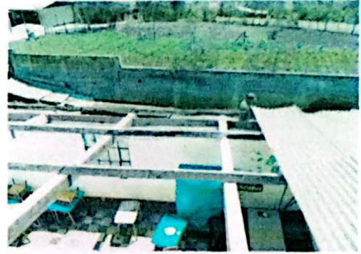
Foto 2: Situación de la estructura remosando edificio uno parte alta.