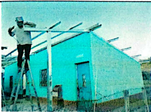
Foto 5: Situación colocando la estructura nueva edificio uno parte alta.