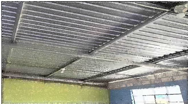
Foto 3: Modulo 2 cambio de instalación eléctrica donde se va a cambiar el techo