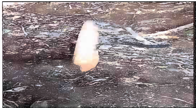
Foto 4: Modulo 3 cambio de tubería de aguas negras, de los baños de la escuela, a la fosa séptica