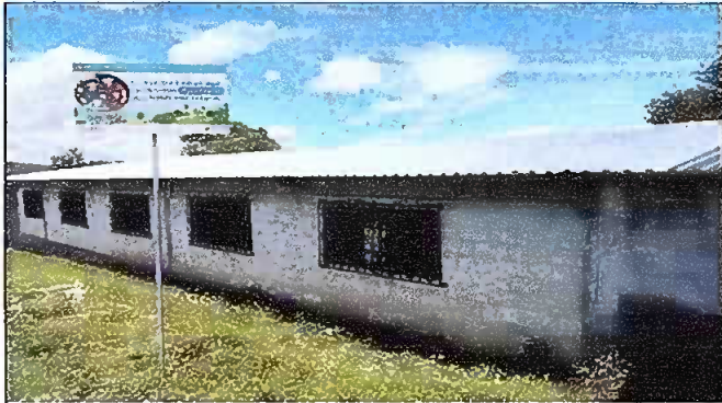
Foto1: Modulo 1 cambio de lámina y estructura de soporte