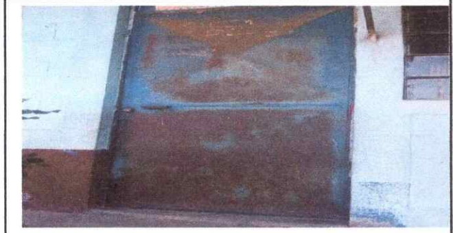
Foto1: Sustitución de puertas.