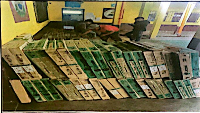
Foto1: Estado actual de las aulas