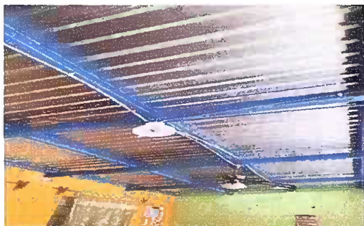
Foto1: ( techo en aula 1 )