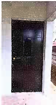
Foto3: Modulo 1: Sustitucion de puerta de madera, por puerta de metal