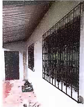
Foto 4: Modulo 1 Sustitucion de ventanas de madera por metal mas vidrio