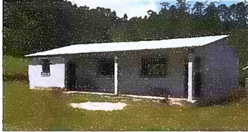
Foto1: Modulo 1: Sustitución de lámina, por lámina troquelada aluzinc calibre 26