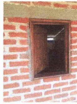
Foto 4: Modulo 1 Sustitución de ventanas de madera por metal mas vidrio