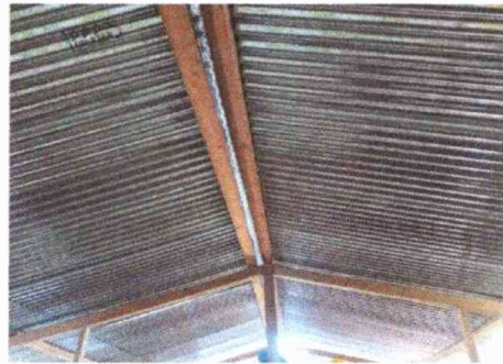
Foto2: Modulo 1: Sustitución de estructura de soporte de madera, por metal