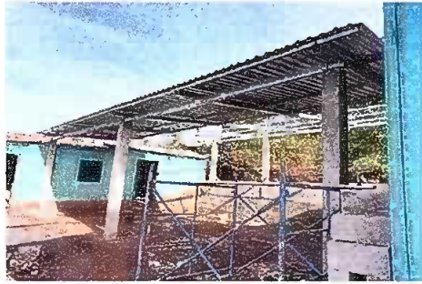
Foto 1: Área recreativa. Sustitución de lámina, por lámina troquelada aluzinc calibre 26 y sustiñ de estructura de soporte de madera, por metal