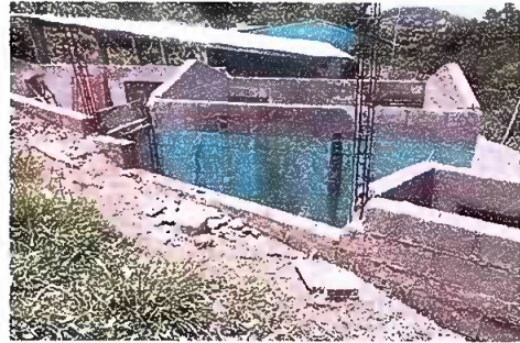
Foto 2: Cocina y Bodega. Sustitución de lámina, por lámina troquelada aluzinc calibre 26 y sustiñ de estructura de soporte de madera, por metal