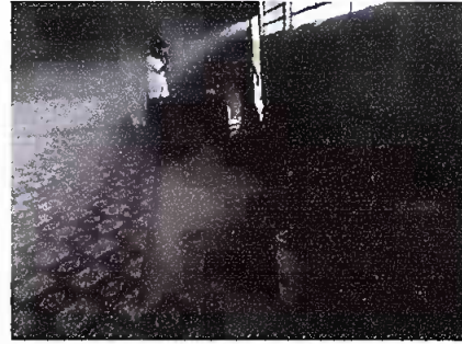
Foto No. 3, MODULO I Colocación de piso ceramico.