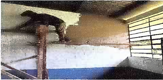
Foto No. 4, MODULO I Repello de paredes

Observación: Si es necesario se pueden agregar hojas adicionales y actualizar el número de hojas.