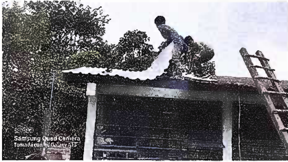
Foto No. 1, MODULO I Sustitución de laminas en mal estado