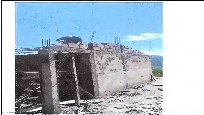
Foto2: Módulo 1 Reparación de pared de block (incluye cemento, columnas y tolteras)