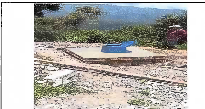
Foto 6: Letrina Sustitución de Inodoro de concreto por Inodoro de plastico.

Observación: Si es necesario se pueden agregar hojas adicionales y actualizar el número de hojas.