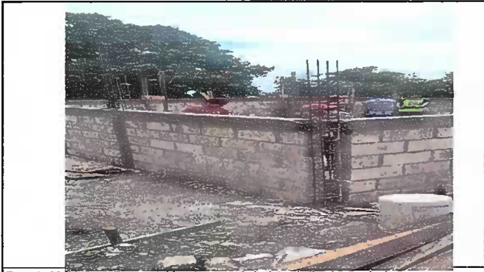
Foto1: Módulo 1 Reparación de pared de block (Incluye cemento, columnas y soleras)