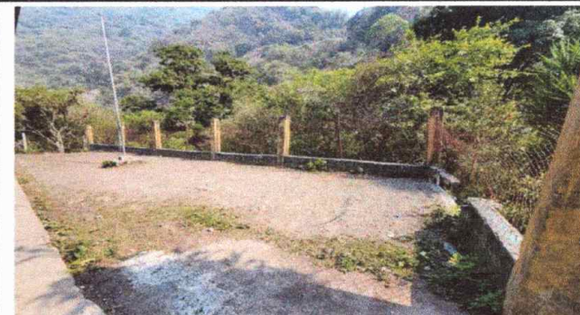
Foto 4, Reparación de muro perimetral de block con tubo hg y malla galvanizada, soleras intermedias y columnas.

Observación: Si es necesario se pueden agregar hojas adicionales y actualizar el número de hojas.