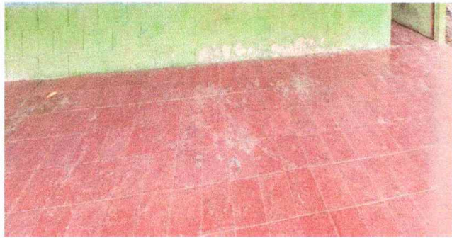
Foto1, módulo 1: Sustitución de piso por cerámico