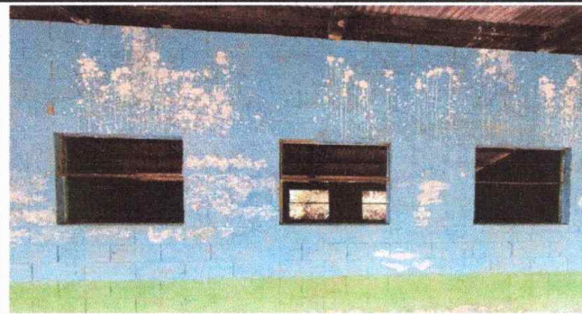
Foto3, Módulo 1: Suministros e instalación de ventanas con balcón