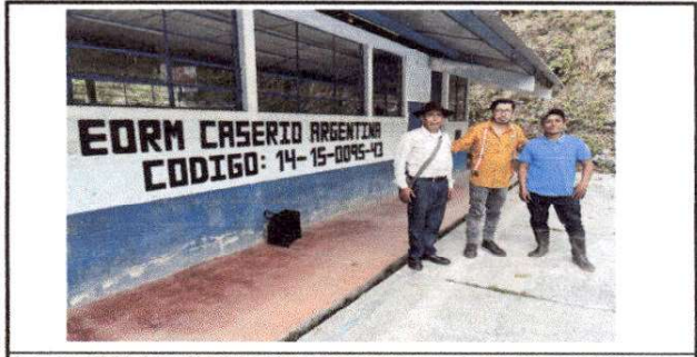
Foto 12: FOTO CON PRESIDENTE Y DIRECTOR DE LA OPF DE LA ESCUELA, AL FINALIZAR VISITA.

Firma y sello del Presidente de la OPF de Caserío Argentina, Quiché