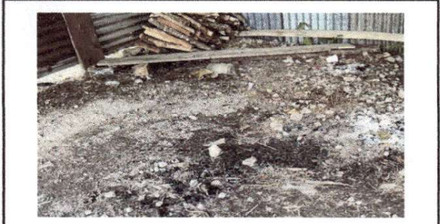
Foto 8: LA BASE DE LA COCINA ES DE TIERRA, BASTANTE IRREGULAR Y CON AREA DE FUEGO IMPROVISADAS CON BASES HECHIZAS DE METAL O BLOCK.