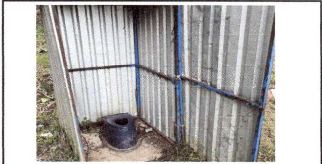
Foto 10: MODULOS DE SANITARIOS CON ESTRUCTURA Y CUBIERTAS DETERIORADAS.