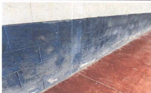
Foto 3: EL MODULO DE AULAS CUENTA CON DETERIORO Y FALTA DE MANTENIMIENTO DE PINTURA.