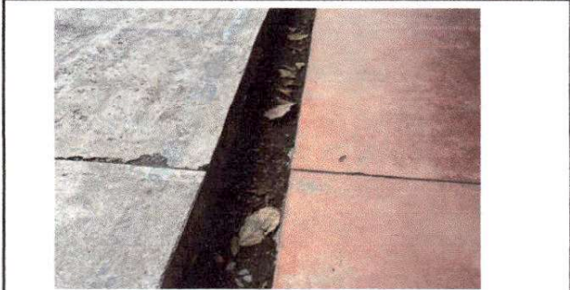
Foto 7: ENTRE JUNTAS DE TORTA DE CONCRETO DE CANCHA Y TORTA DE CONCRETO DE CORREDOR EXISTE UNA ZANJA QUE ACUMULA AGUA EN DIAS DE LLUVIA.