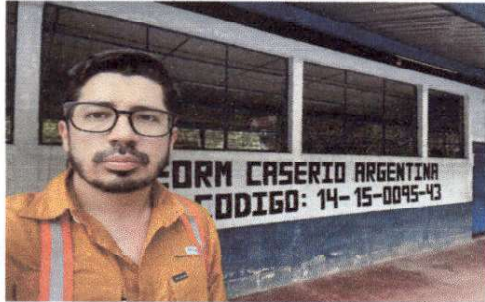
Foto 1: FOTO CON NOMBRE DE ESCUELA AL FONDO, AL INGRESO DE LA VISITA.