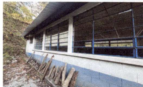
Foto 6: EL TECHO NO CUENTA CON UN CANAL DE BAJADA DE AGUA, EL CUAL COMPLICA EL ESCURRIMIENTO DEL AGUA EN CORREDOR.

Firma y sello del Presidente del Consejo Educativo de Caserío Argentina, San Miguel Usulután, Quiché.