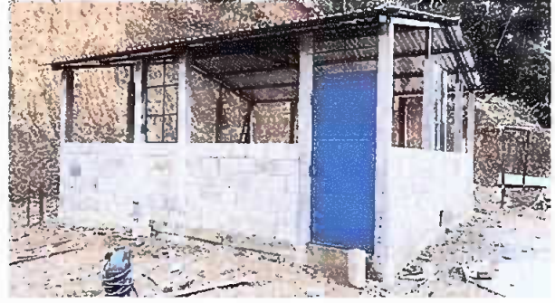
Foto 2: Modulo 1, Reparación de pared de block (incluye cimiento, columnas y solera)