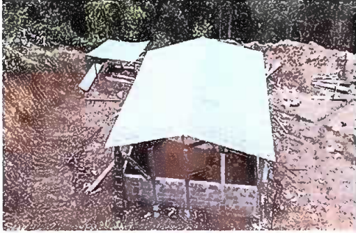
Foto 1: Modulo 1, Reparación de pared de block (incluye cimiento, columnas y solera)