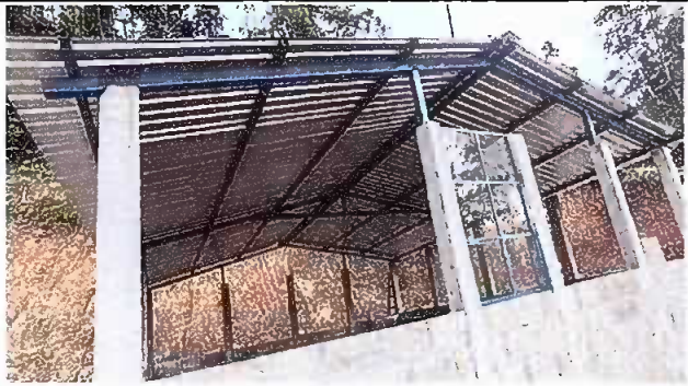
Foto 3: Modulo 1, Reparación de pared de block (incluye cimiento, columnas y solera)

Observación: Si es necesario se pueden agregar hojas adicionales y actualizar el número de hojas.