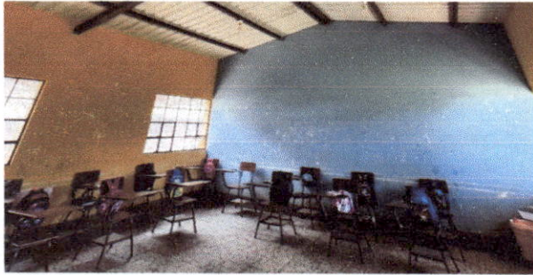
Foto 1: FALTA DE MANTENIMIENTO DE PINTURA INTERIOR EN MODULO DE AULAS