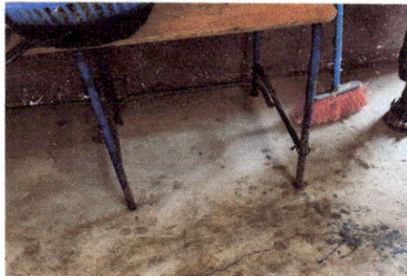
Foto 6: LA BODEGA ES EL UNICO AMBIENTE DEL MODULO SIN PISO, EL CUAL SOLICITAN COMPLETARLO.