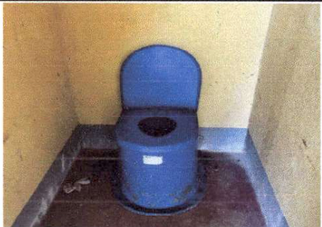
Foto 7: SANITARIOS CON PINTURA INTERIOR Y EXTERIOR SIN MANTENIMIENTO.