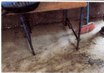
Foto 6: LA BODEGA ES EL UNICO AMBIENTE DEL MODULO SIN PISO, EL CUAL SOLICITAN COMPLETARLO.