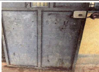
Foto 4: DETERIORO Y PRESENCIA DE OXIDO DE PUERTAS DE METAL DE AULAS.