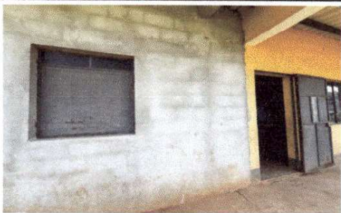
Foto 5: BODEGA DEL MODULO NO CUENTA CON VENTANA DE VIDRIO, HACIENDO DEL AMBIENTE UN LUGAR OSCURO Y SIN VENTILACION.