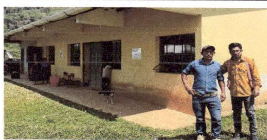
Foto 12: FOTO CON PRESIDENTE OPF DE LA ESCUELA, AL FINALIZAR VISITA.