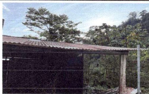
Foto 10: LAMINA DE COCINA MUY DAÑADA Y YA SE ENCUENTRA LASTIMADA.