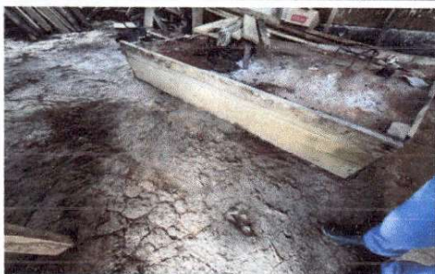
Foto 9: COCINA SIN PISO FIRME Y CON ESTUFAS IMPROVISADAS CON MATERIAL NO ADECUADO.