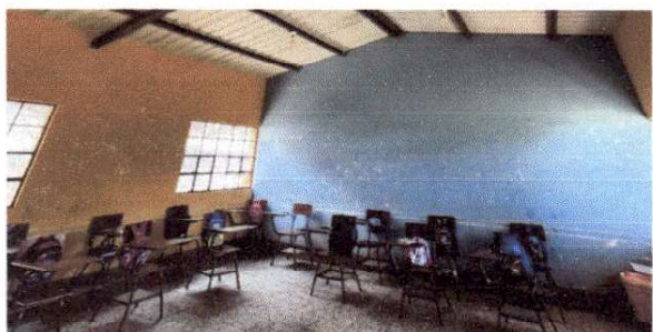
Foto 1: FALTA DE MANTENIMIENTO DE PINTURA INTERIOR EN MODULO DE AULAS