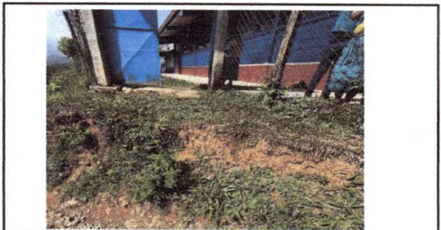
Foto 10: EL ACCESO PRINCIPAL A LA ESCUELA ES COMPLICADO, ALTO Y PELIGROSO