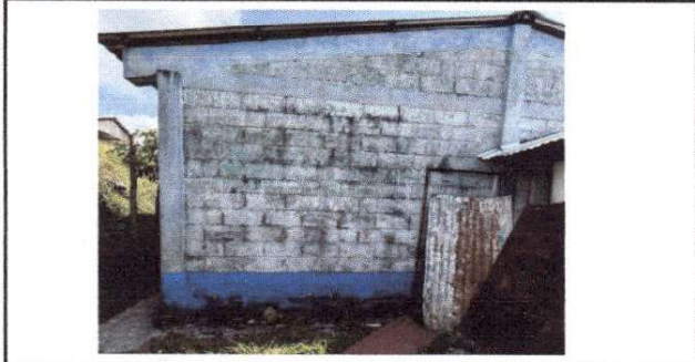
Foto1: PINTURA EXTERIOR DE AULAS DETERIORADA.