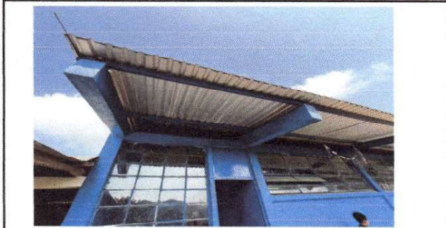
Foto 3: CORREDOR PRINCIPAL DEL MODULO, SIN CANAL DE BAJADA DE AGUA.