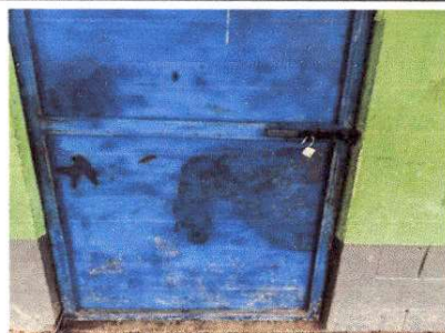
Foto 6: LAS PUERTAS DE TODOS LOS SANITARIOS SE ENCUENTRAN EN MALAS CONDICIONES, MANCHADAS Y OXIDADAS.