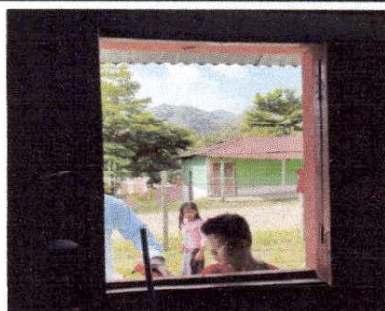
Foto 4: EL MODULO NO CUENTA CON VENTANAS DE VIDRIO Y CON Poca ILUMINACION NATURAL.