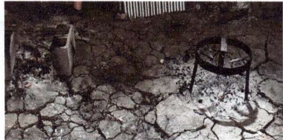
Foto 8: HORNILLAS HECHIZAS Y DE BLOCKS, PARA COLOCACION DE OLLAS PARA PREPARACION DE COMIDA.