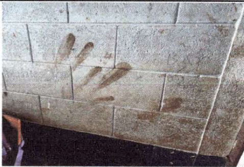
Foto1: PINTURA INTERIOR DE TODAS LAS AULAS SIN MANTENIMIENTO.