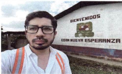
Foto 11: FOTO CON NOMBRE DE LA ESCUELA AL FONDO, AL FINALIZAR LA VISITA.