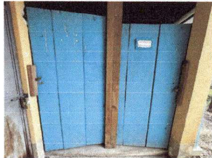
Foto 10: PUERTAS DE SANITARIOS DE MAESTROS IMPROVISADAS, DE MADERA.