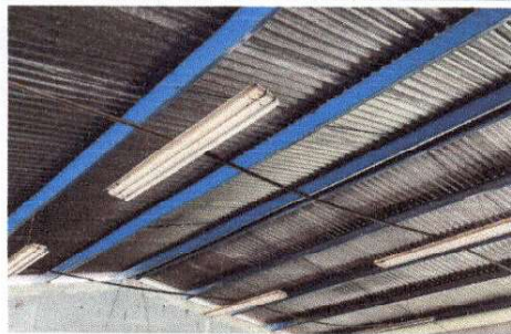
Foto 5: LAMPARAS EN SU TOTALIDAD SIN FUNCIONAMIENTO Y CONEXIONES ARRUINADAS.