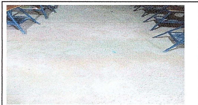
MODULO 1. FOTO 5 Reparacion de piso de torta de Concreto

Observación: Si es necesario se pueden agregar hojas adicionales y actualizar el número de hojas.