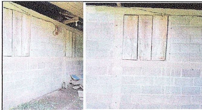
MODULO 1. FOTO 3 Sustitucion de ventana de metal mas vidrio con Valcon