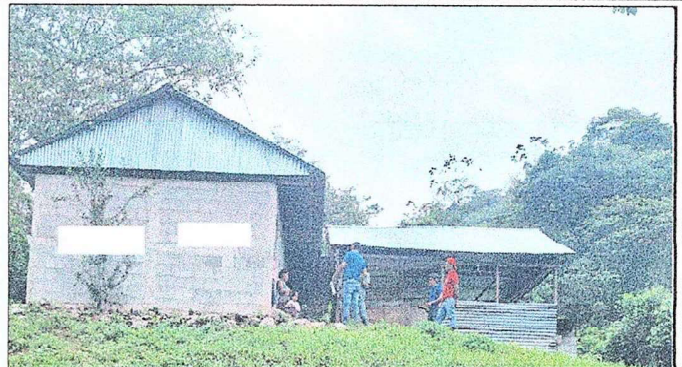
MODULO 1. FOTO 2 Apertura y Tallado de Vano y Suministro e inatacion de ventana de metal mas vidrio mas Valcon