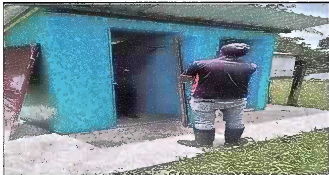
FOTO. 5 MODULO III Sustrición de puertas de servicio sanitario