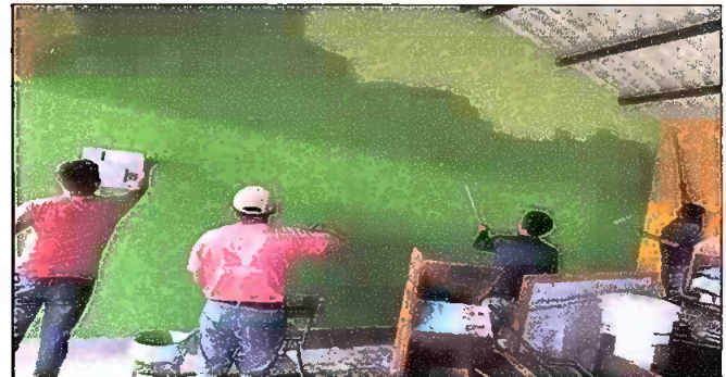
FOTO. 6 PINTURA GENERAL: Pintura en muros exteriores e interiores

Observación: Si es necesario se pueden agregar hojas adicionales y actualizar el número de hojas.