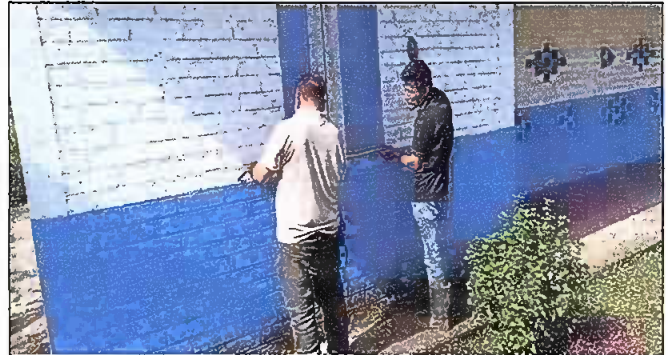
FOTO.2 Modulo I : Sustrición de ventanas de madera por metal mas vidrio