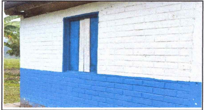
FOTO.2 Modulo I : Sustitución de ventanas de madera por metal mas vidrio