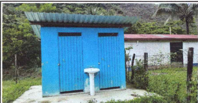
FOTO. 5 MODULO III Sustitucion de puertas de servicio sanitario