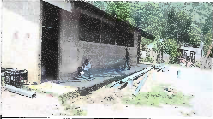
Foto1: corte de costaneras.