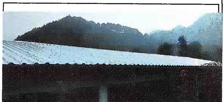
foto 6. colocación de lamina del techo

Observación: Si es necesario se pueden agregar hojas adicionales y actualizar el número de hojas.