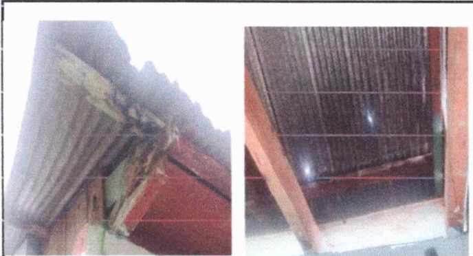
Foto1: Aula No. 1 Cambio de techo, láminas y vigas en mal estado.