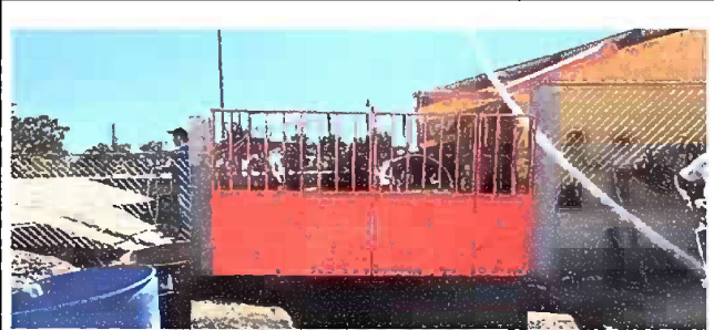
Foto 4: Fundición de columnas y Sustitución de portón en mal estado.