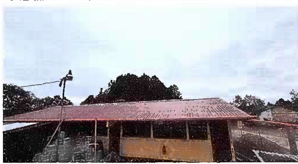
Foto1: Modulo 1: sustitucion de lamina por lamina troquelada y de canal en mal estado por tubo pvc.