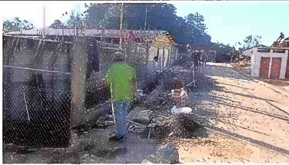
Foto 3: Sustitución de malla perimetral en mal estado en toda la escuela