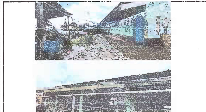
Foto 1: Modulo 1: Mantenimiento a puertas de metal, sustitucion de canal en mal estado por canal pvc y pintura interior y exterior del modulo.