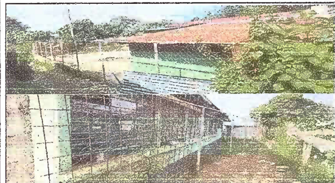
Foto 3: Sustitución de malla perimetral en mal estado en toda la escuela