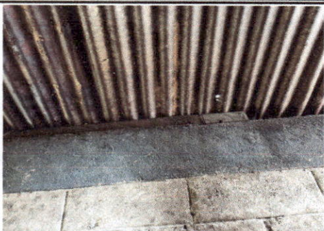
Foto 7: LAMINA DEL TECHO DE LA COCINA, MUY DETERIORADA Y CON FILTRACIONES.