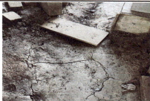
Foto 9: ACTUALMENTE LA COCINA NO CUENTA CON PISO FIRME, SIENDO ESTE DE TIERRA.