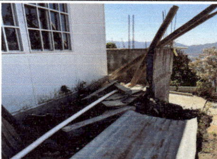
Foto 10: MURO PERIMETRAL ANEXO A LA COCINA TOTALMENTE COLAPSADO, REPRESENTANDO UN PELIGRO A USUARIOS.