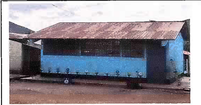
Foto1: Modulo 1: Sustitución de Lámina