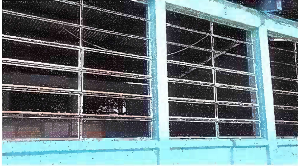
Foto7: Modulo 3: Sustitución de vidrios