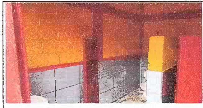
INSTALACION DE AZULEJO EN BAÑOS