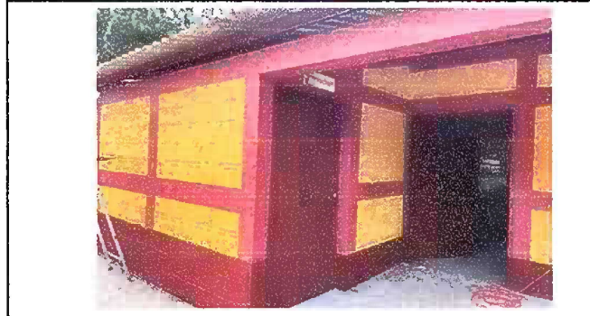
Foto 4: Mantenimiento de lijado, pintado y cambio de Chapas de todas las puertas del modulo 1