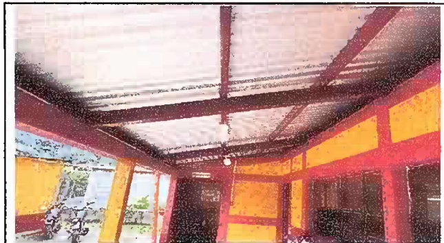
Foto 2: Modulo 1: Mantenimiento y Sustitucion de toda la red electrica de todo el modulo.