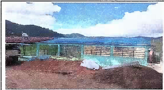
Foto1: MODULO 1: SUSTITUCIÓN DE LÁMINA