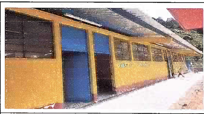
Foto 6: MODULO 1: PINTURA GENERAL EN MUROS EXTERIORES E INTERIORES

Observación: Si es necesario se pueden agregar hojas adicionales y actualizar el número de hojas.