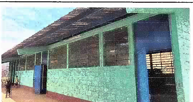
Foto 6: MODULO 1: PINTURA GENERAL EN MUROS EXTERIORES E INTERIORES

Observación: Si es necesario se pueden agregar hojas adicionales y actualizar el número de hojas.