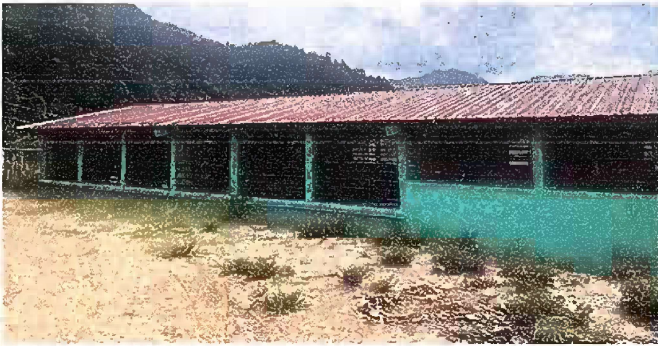
Foto1: MODULO 1: SUSTITUCIÓN DE LÁMINA