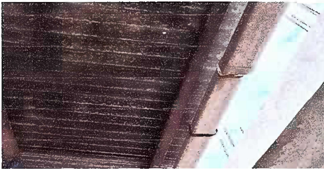
Foto 3: MODULO 1: MANTENIMIENTO DE ESTRUCTURA DE SOPORTE Y SUSTITUCION DE CANAL