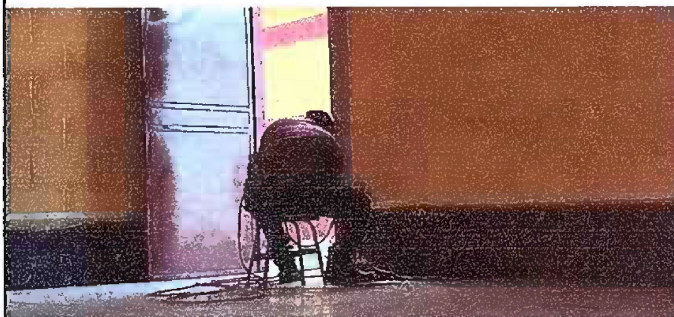
Foto 4: Cambio de Chapas por estar en mal estado de todos los modulos.