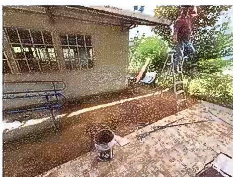
Foto 3: Modulo 2: Fundición de Torta de Cemento en area del modulo pre fabricado.