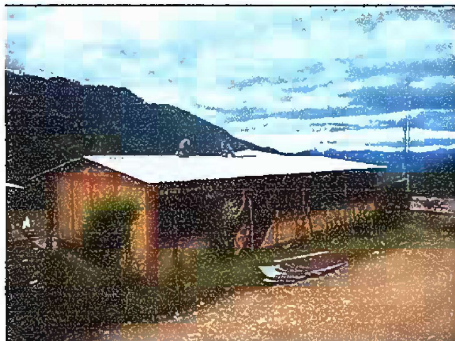
Foto1: Modulo 1: Mantenimiento de estructura de metal del techo y sustitución de lamina en mal estado.