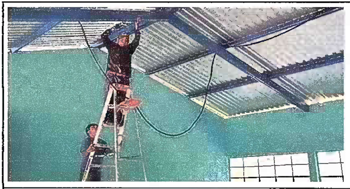
Foto5: MODULO 1: SUSTITUCIÓN DE LÁMPARAS