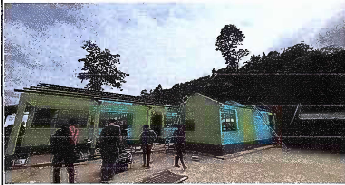
Foto1: MODULO 1: SUSTITUCIÓN DE LÁMINA