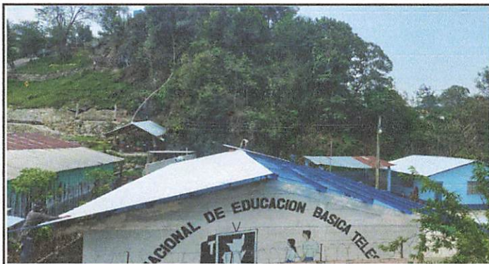
Foto1: MODULO 1 Sustitucion de lámina, sustitucion de capote, sustitucion de vidrios y sustitucion de balcones.