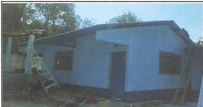
Foto 3: MODULO 2 Sustitucion de estructura de soporte de metal, por metal y de lámina.