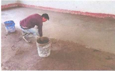
Módulo 1: Sustitución de piso de ladrillo a piso de concreto

Aquí no se percató tomar fotografía cuando estaba en proceso de sustitución, Módulo 1: Sustitución de piso de ladrillo a piso de concreto