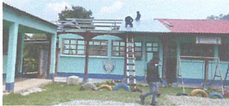
Módulo 1: Sustitución de lámina por lámina troquelada y sustitución de estructura portante de madera por metal.

Aquí no se percató tomar fotografía cuando estaba en proceso de sustitución, Módulo 1: Sustitución de piso de ladrillo a piso de concreto