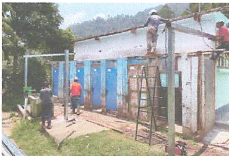
Módulo 2: Sustitución de puertas de madera a metal, lamina a lamina troquelada y sustitución de estructura portante de madera a metal.

También en este módulo no se percató tomar fotografía cuando estaba en proceso. Módulo 4: Sustitución de Lámina a lamina troquelada y sustitución de estructura portante de madera a metal.