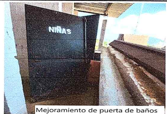
Mejoramiento de puerta de baños