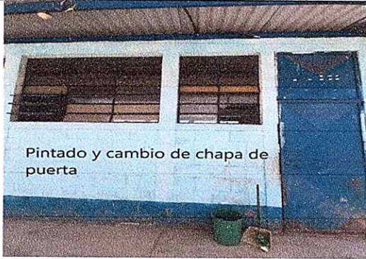
Pintado y cambio de chapa de puerta