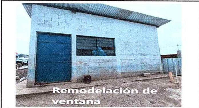
Remodelación de ventana