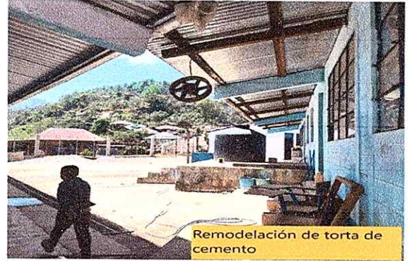
Remodelación de torta de cemento