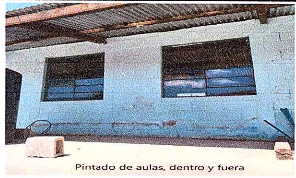
Pintado de aulas, dentro y fuera