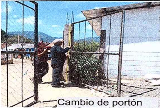
Cambio de portón