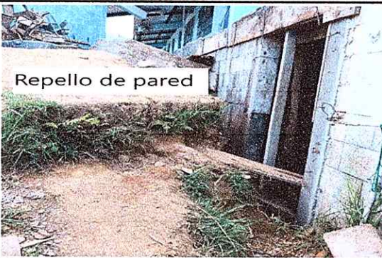
Repello de pared