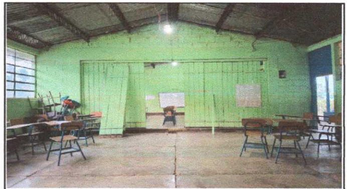
Módulo 1: Reparación de muro perimetral de block (ambiente interno)