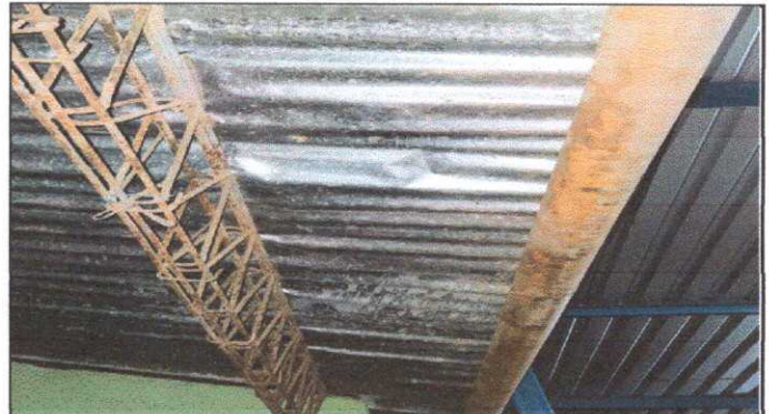
Módulo 1: Canal Pluvial por rubro de canales PVC