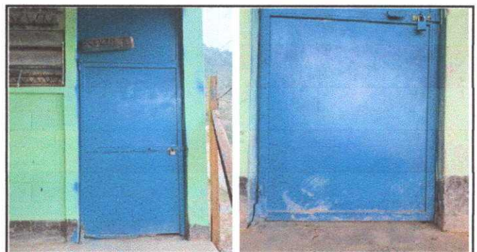
Módulo 2: Sustitución de puertas

Observación: Si es necesario se pueden agregar hojas adicionales y actualizar el número de hojas.