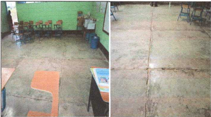
Módulo 1: Sustitución de pisos de cemento liquido