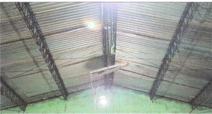
Módulo 1: Sustitución de lampara tipo LED y plafoneras