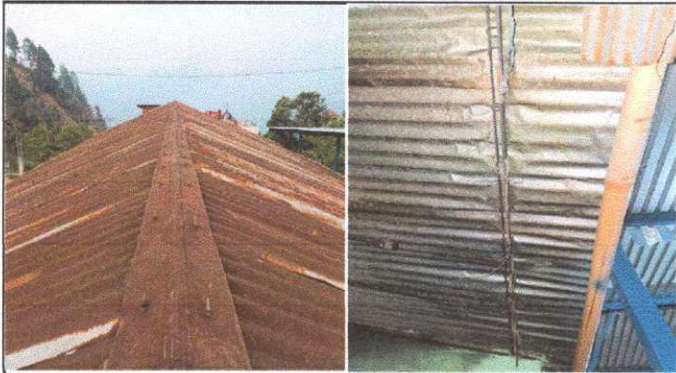
Módulo 1: Sustitución de lámina, por lámina troquelada aluzinc calibre 26, capote de lámina para lámina troquelada Y Sustitución de elementos de fijación